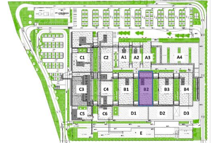
Plano de Ubicación