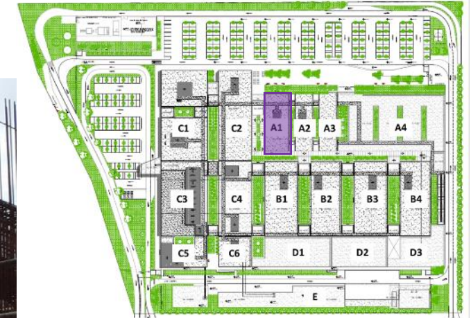
Plano de Ubicación