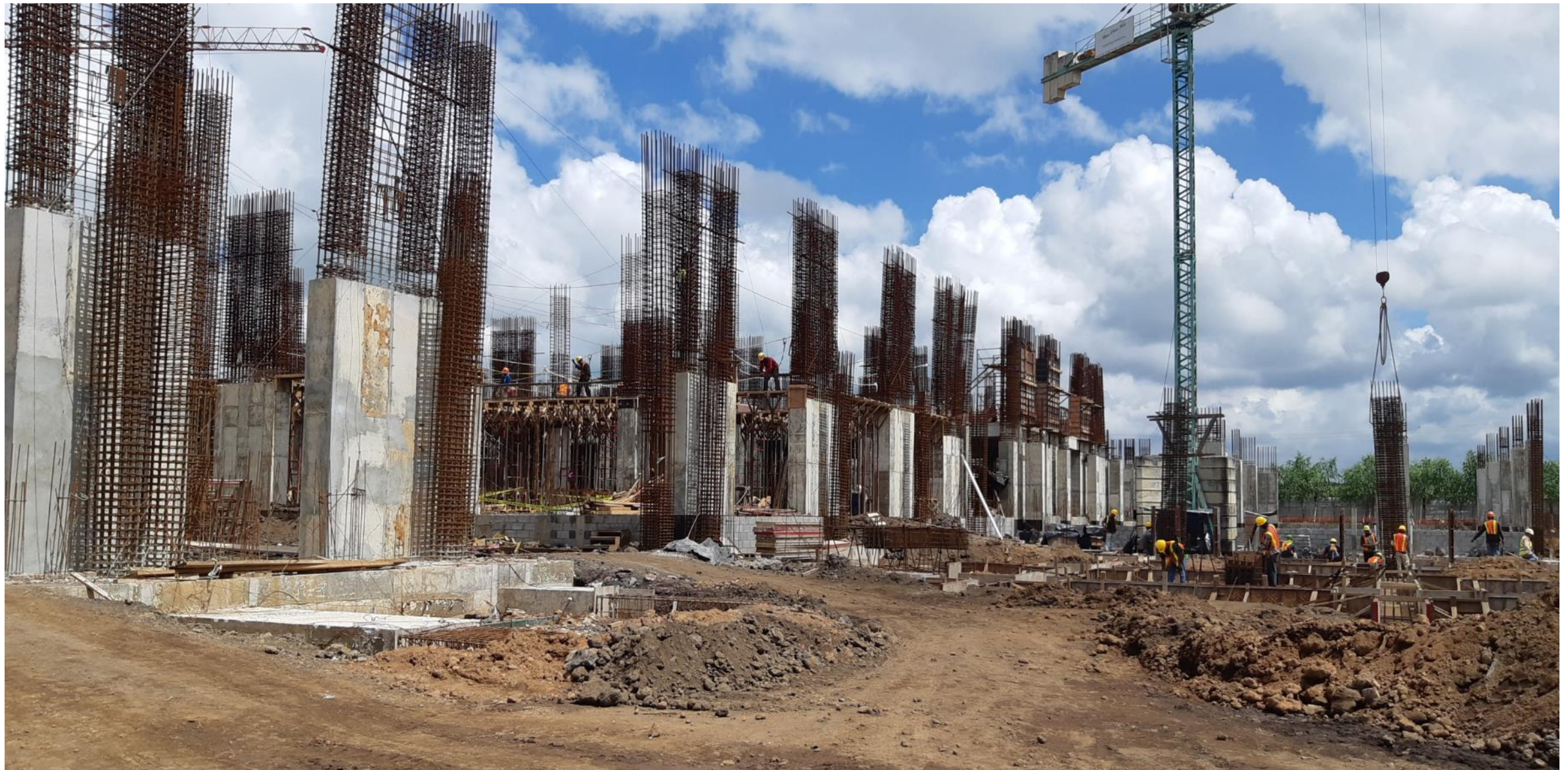
Fecha de corte: 05 de octubre del 2019