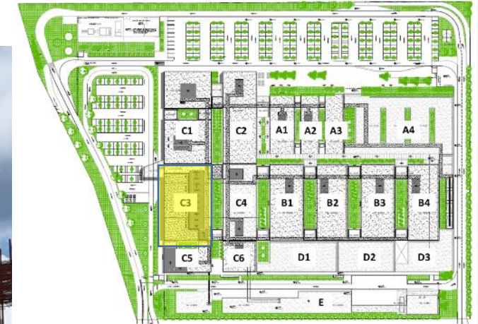
Plano de Ubicación