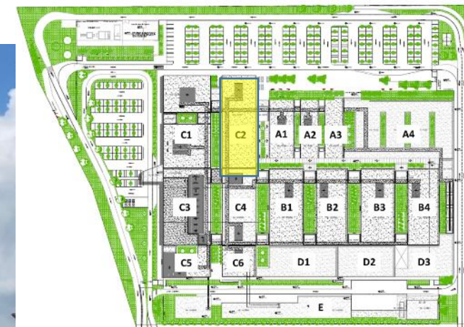
Plano de Ubicación