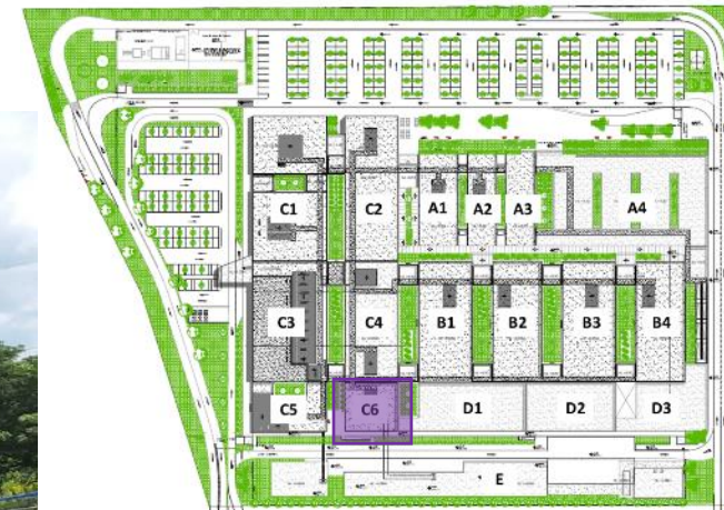
Plano de Ubicación