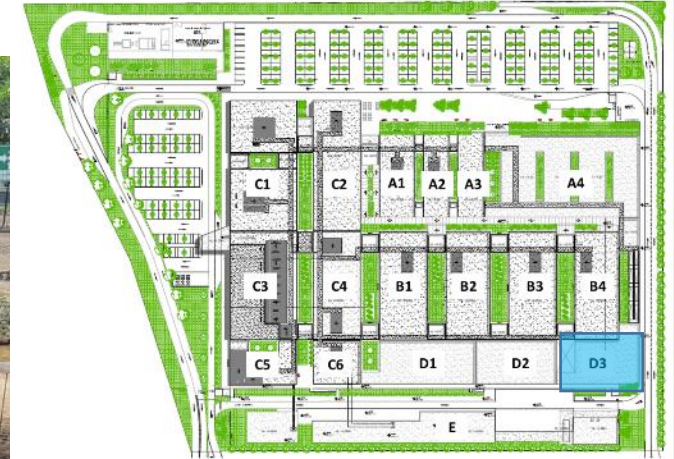
Plano de Ubicación